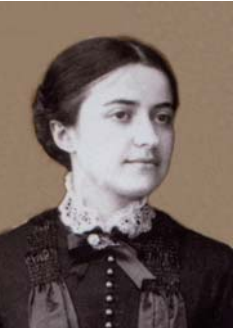
Pauline Martin, die spätere Sr. Agnes