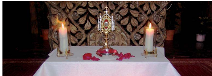
Neues Reliquiar der Hl. Thérèse im Wallfahrtsort Marienthal, Westerwald