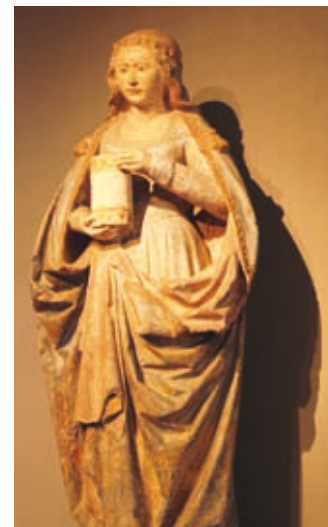
Maria von Magdala, Autun

Herzens und aus einem unmittelbaren Zugang zu den Mysterien der Offenbarung entfaltet hatten; nur die größten Namen seien genannt: Hildegard, Gertrud, Mechthild von Hackeborn, Mechthild von Magdeburg, Juliana von Norwich, Caterina von Siena ... Aber diese Theologie der Frauen ist von der Zunft nie ernst und voll genommen worden; niemand dachte daran, sie zu studieren, ihre Einsichten in die Schatztruhen der kirchlichen Überlieferung einzu-bergen. Dies müßte spätestens heute, da das ganze Gebäude der Theologie von Grund aus neu aufgeführt wird, nachgeholt werden. Stand nicht zu erwarten, daß Gott insbesondere seinen Heiligen die Geheimnisse seines Herzens durch die Zeiten hindurch am tiefsten erschließen würde?